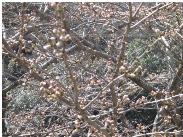
3/26 先端がほころび始めました。