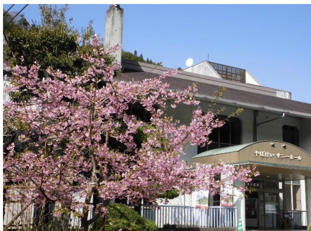
3/23 図書館入口の河津桜が色鮮やかです。