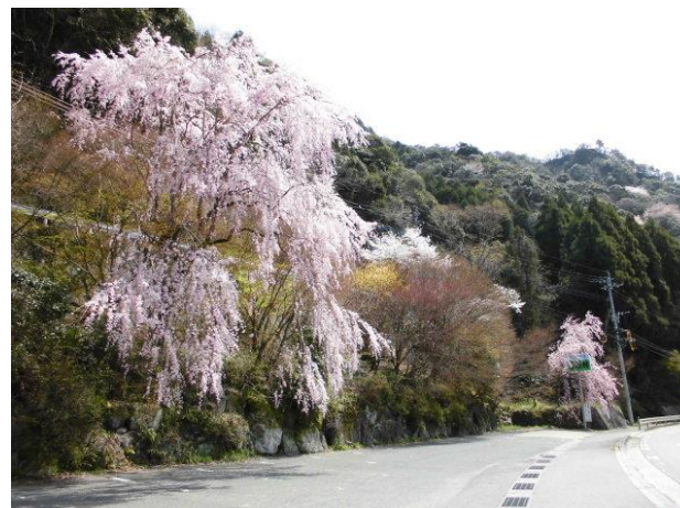
3/29 耶馬溪町柿坂の国道212号沿いの「柿坂村」一画のしだれ桜。夜はライトアップも。