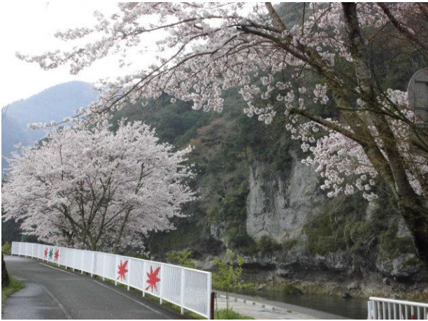
4/9 満開の桜と「擲筆峰(てきひっぽう)」と