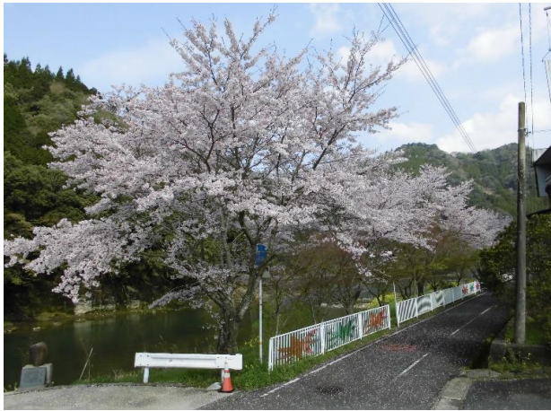
4/12 桜が散りはじめ、花弁が舞っています。