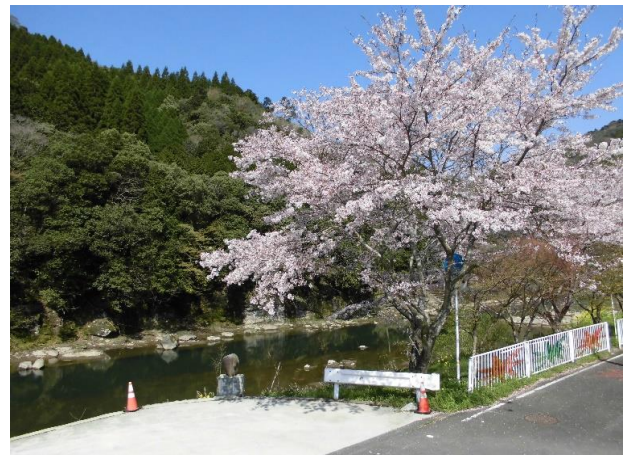
4/14 青空と桜と菜の花のコントラストが綺麗！