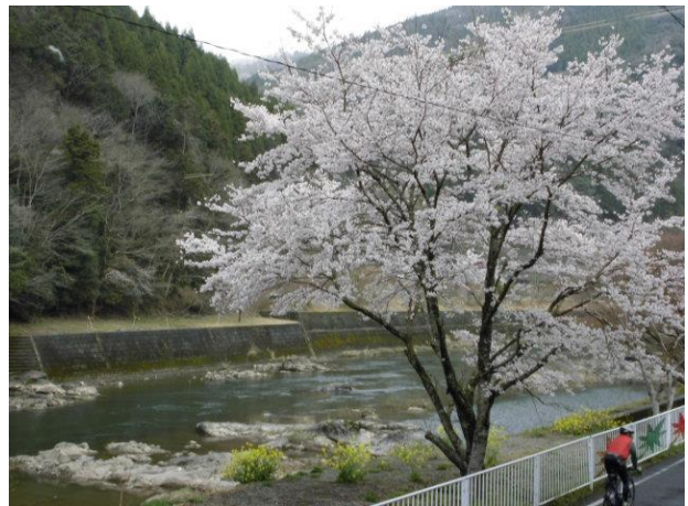
4/9 桜を楽しみながらサイクリング 🚲