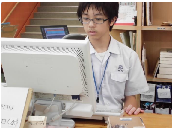
パソコン作業も手慣れたように、テキパキとできました。