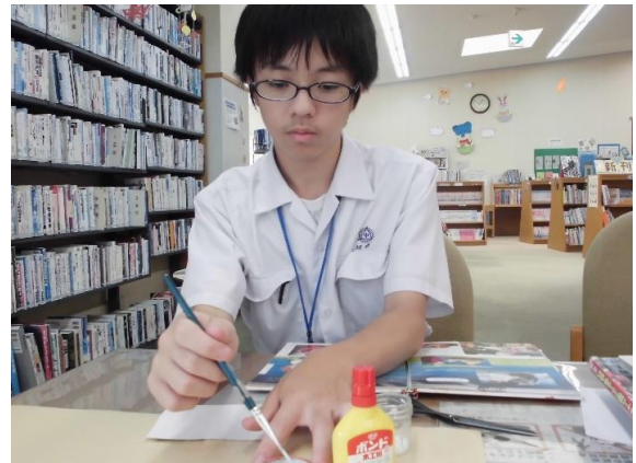
本のページが取れたり、破れている個所を修理しました。