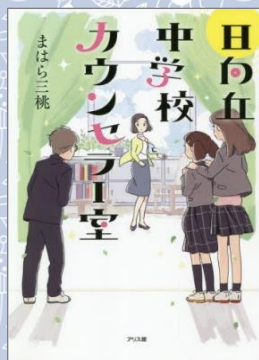
『日向丘中学校 カウンセラー室』 まはら 三桃／著 (アリス館)

友達の作り方を教えてほしいという女の子、自分の居場所を見つけられない男の子…。日向丘中学校のカウンセラー室にいる綾さんのもとには、いろいろな生徒が相談をしにやってきて…。心あたたまる連作短編集。