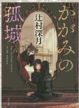
『かがみの孤城』 辻村 深月／著 (ポプラ社)

そんな中学生におすすめしたい20冊の本を、様々なジャンルから選んでみました。ぜひ夢中になれる1冊を見つけてくださいね。