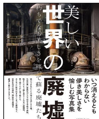
『美しい世界の廃墟』 MdN編集部／編