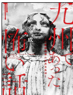
『九州であった怖い話』 濱 幸成／著