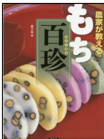
「農家が教えるもち百珍」 農文協／編