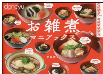
「お雑煮マニアックス」 粕谷 浩子／[著]