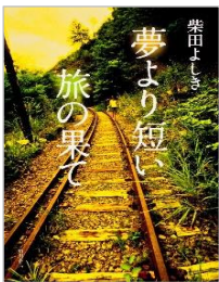
『夢より短い旅の果て』 柴田 よしき / 角川書店

中学生の時に失踪した叔父を探すために大学の鉄道旅同好会に入った香澄(かすみ)。最初は興味のなかった鉄道旅の魅力に次第に目覚めていく。鉄道旅をしながら無事叔父を探し出すことができるのか。