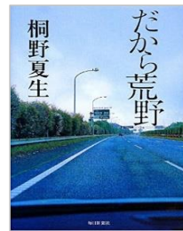
『だから荒野』 桐野 夏生 / 毎日新聞社

心に傷を負ったワケあり男二人の神社巡り珍道中。そこにワケあり女も加わって・・・笑いあり涙ありの青春ロード小説。読み終わった後には、神社や日本の神様について詳しくなっているかも。