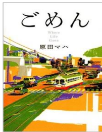
『ごめん』 原田 マハ / 講談社

どこが秘密めいた青年と小生意気な元野良猫のお話。ある時、一人と一匹は旅に出る。その旅の行方とは・・・人と生き物との深い愛情が感じられる作品です。涙なしでは読めません。