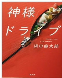
『神様ドライブ』 浜口 倫太郎 / 講談社

中学生の時に失踪した叔父を探すために大学の鉄道旅同好会に入った香澄(かすみ)。最初は興味のなかった鉄道旅の魅力に次第に目覚めていく。鉄道旅をしながら無事叔父を探し出すことができるのか。