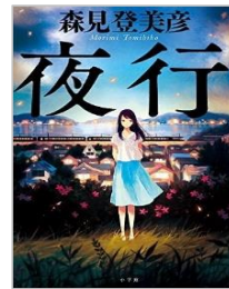
『夜行』 森見 登美彦 / 小学館

意識不明の夫の口座に振り込まれた謎のお金。隠し事がない夫だと思っていたのに。妻は振り込み主を探しに高知へと旅立つ。人生の岐路に立った女性たちの物語。